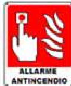
Pulsante allarme incendio