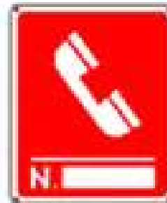
Telefono interventi antincendio