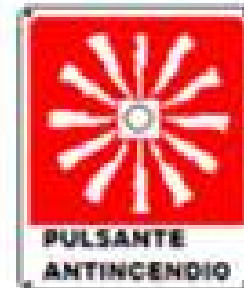
Pulsante allarme incendio